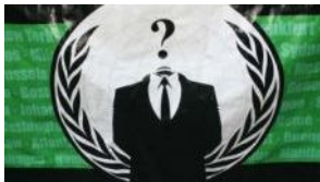
Le logo des Anonymous

Les Anonymous ont appelé à utiliser le logiciel LOIC afin de saturer les sites des sociétés américaines de droits d'auteurs. Plusieurs millions d'internautes auraient répondu à l'appel de cette "manifestation du futur".